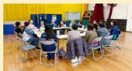
ボランティアが主体で行うサロン活動

◆お願い◆ 災害ボランティア活動をお考えの方は、事前に現地のボランティア受入れ状況等をよくご確認の上、活動をご検討ください。