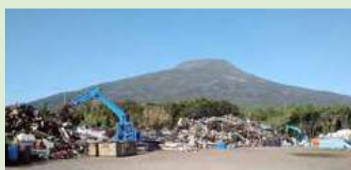
倒壊した民家の瓦礫等を片づける様子